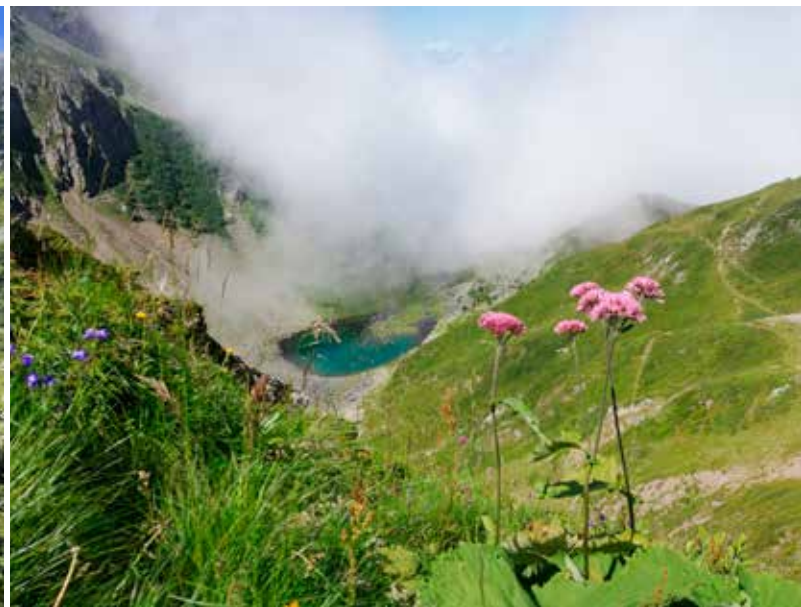
Bergmeer na bergmeer wandelen we voorbij.