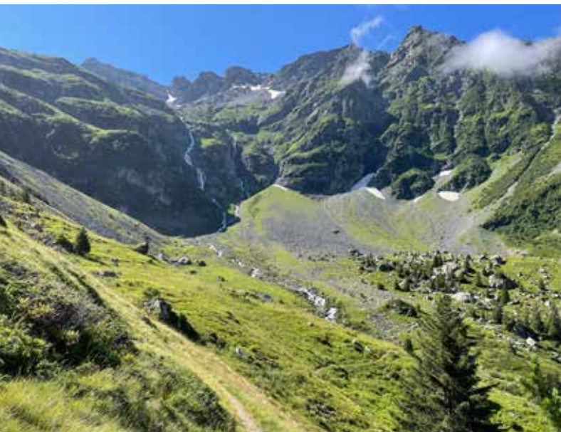
Twee prachtige valleien strekken zich uit aan weerszijden van de Col de la Sitre.