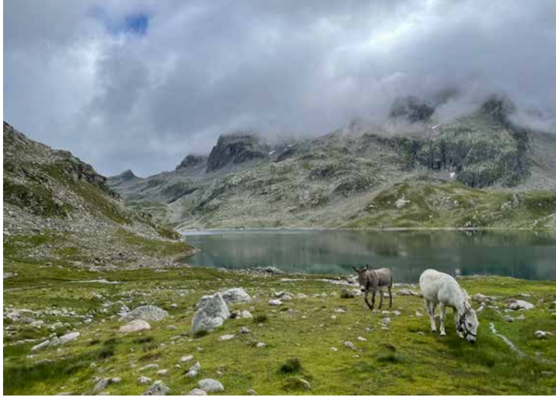
Vlak bij de Refuge des 7 Laux.

de ontbijt tafel stelt me echter gerust: “Chère Lien, het onweer vannacht was uitzonderlijk intens. We zijn er zeker van dat alles goed komt.”