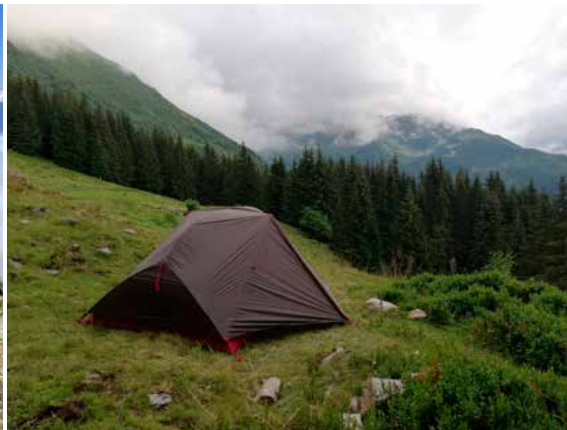
Gerekend in hoogtemeters per kilometer is deze tocht zwaarder dan de GR 20.