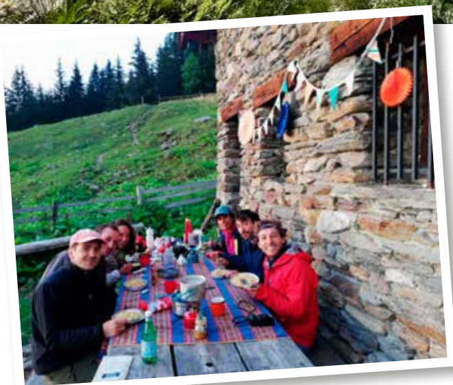
Onverwacht feestje op L'Aup Bernard.